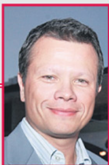
WEST VALDÉS El otro director de FP.