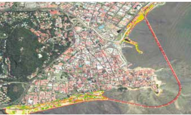
Conexión entre viaducto y la ave. de los Poetas