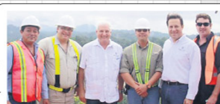
El 4 de abril de 2011, en abierto respaldo a la actividad, por primera vez el presidente Martinelli visitó la mina en Donoso, Colón, para conocer los avances de la empresa, que empezó operaciones comerciales el 8 de enero de 2010.